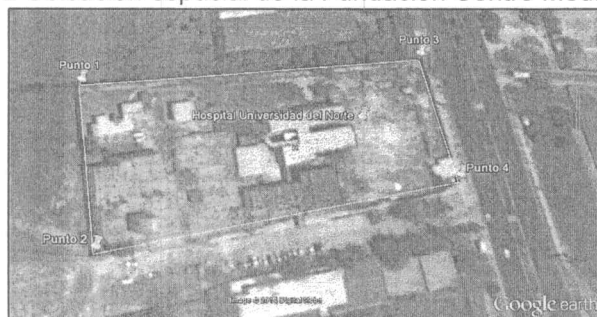
Figura No. 2 Ubicación espacial de la Fundación Centro Médico del Norte

Conforme a ello, se confirma que el certificado de uso del suelo remitido por la Fundación Centro Médico del Norte permite la operación respectiva.